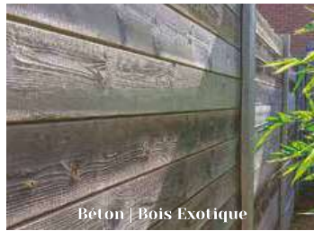
Béton | Bois Exotique