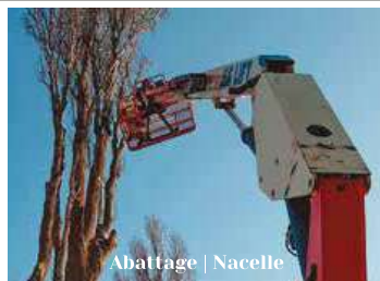
Abattage | Nacelle