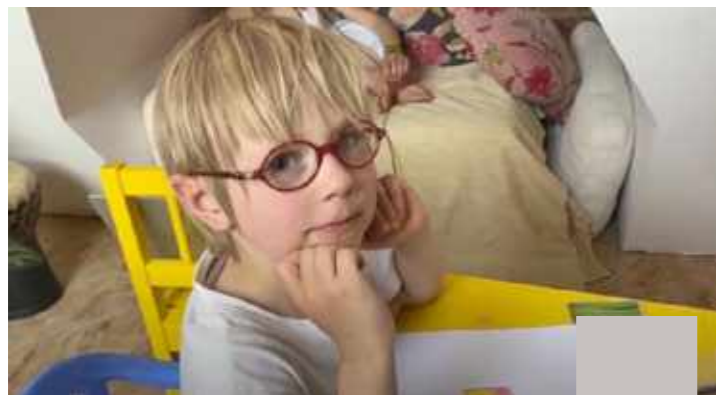
Culture / Cultuur : Des Capsules et Vous