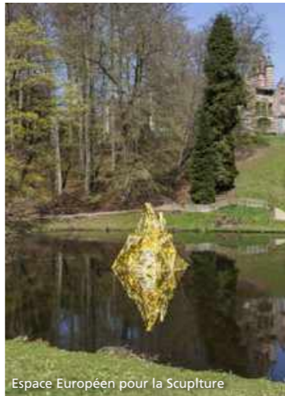
Espace Européen pour la Sculpture

L'Atelier des Merisiers n'est pas vraiment une galerie mais plutôt un endroit (équipé comme une galerie, d'éclairage et de cimaises) mis à la disposition d'artistes qui désirent exposer leur travail pour un prix sympathique ou même parfois en échange d'une œuvre. « L'exposant reçoit les clés de l'espace et peut aménager son exposition comme il l'entend. Il n'y a pas de pourcentage à payer lors de la vente, comme dans une galerie », explique