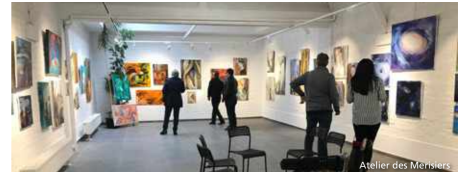
Atelier des Merisiers