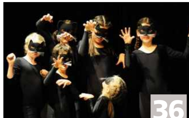
Les academies De academiën