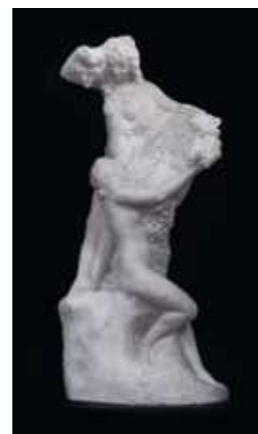
Philippe Wolfers vendu 44.000 euro le 15 juin 2020