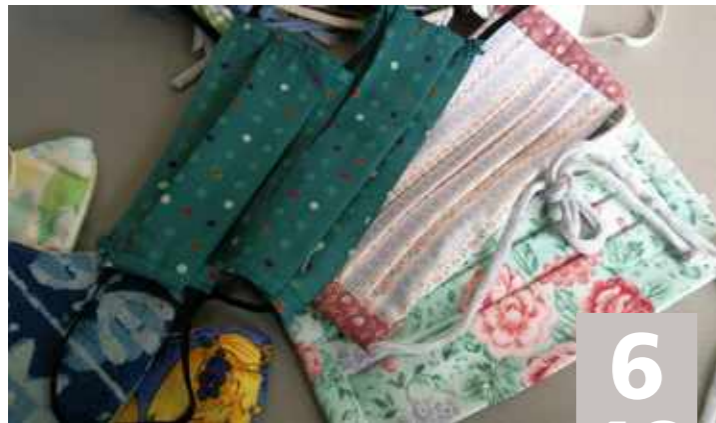
Dossier : COVID-19