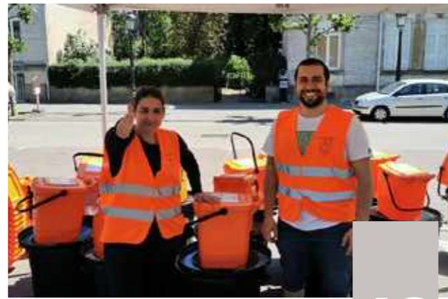
Propreté / Netheid : Les poubelles rigides Stevige vuilbakken