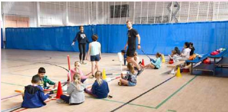
Tous les stages organisés par le CSLI sont encadrés par des moniteurs diplômés.