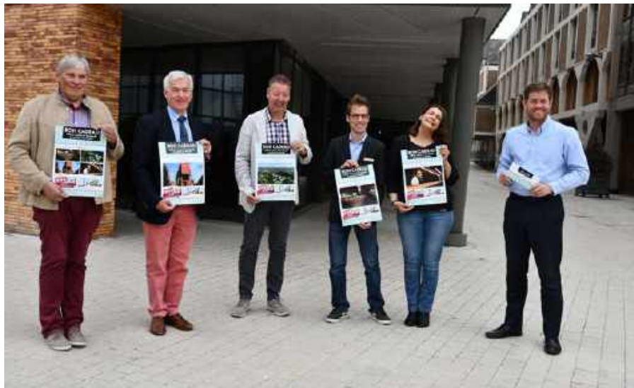
Les hôteliers de Louvain-la-Neuve ont été séduits par l'initiative du « bon-cadeau » imaginée par les responsables de l'Office du Tourisme-Inforville.

L'Office du Tourisme-Inforville a conçu un « bon-cadeau » avec les hôteliers de la cité universitaire, qui comprend la visite d'un ou deux musées, et d'autres avantages.