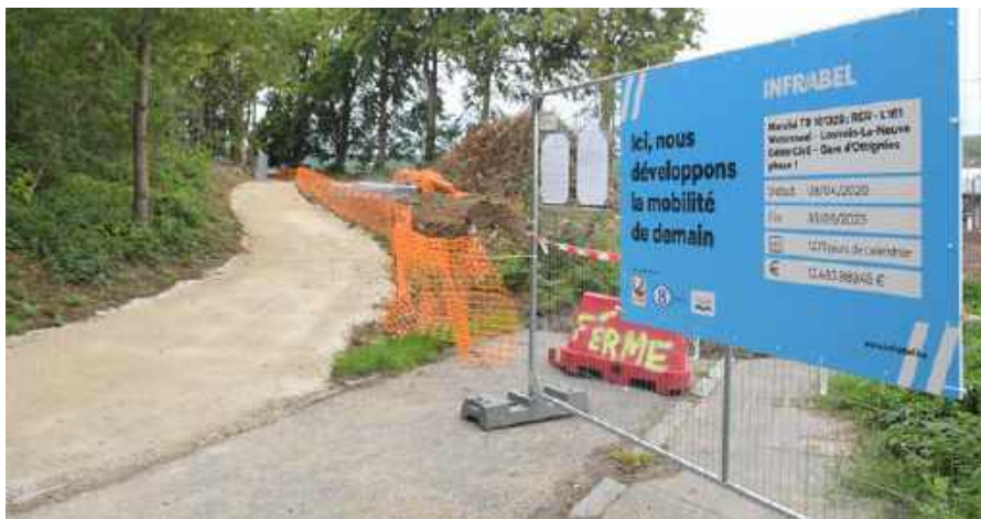
Le chantier en cours, près du parking des Villas.

A la demande de la Ville, Tuc Rail/Infrabel s'est engagée à replanter 15 nouveaux tilleuls, afin de créer un rideau vert dans la nouvelle