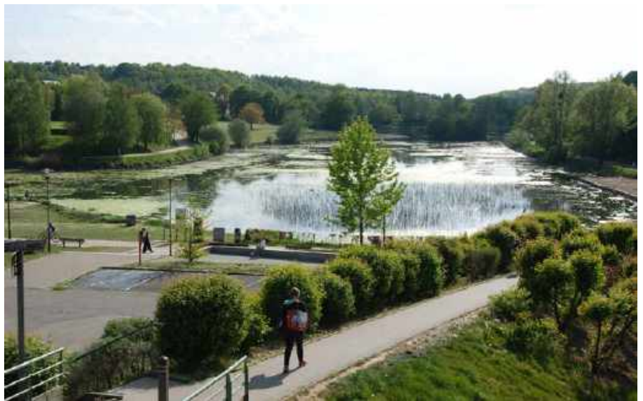
Au début de l'été, le niveau du lac de Louvain-la-Neuve a fortement baissé.

« Un moment, nous avons pensé que la couche d'argile (étanche) avait pu être blessée lors des travaux effectués pendant l'assec. Nous ne pouvons pas l'exclure - de la vase a été raclée à certains endroits pour