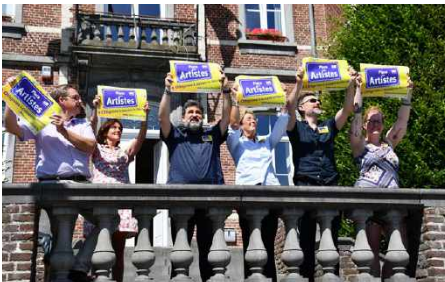
Les opérateurs culturels d'Ottignies-Louvain-la-Neuve ont remis les artistes du Brabant wallon au travail, cet été.

le service des Fêtes et Manifestations, et la police, qui ont revu leur façon de travailler pour octroyer les autorisations dans un délai plus court qu'habituellement.