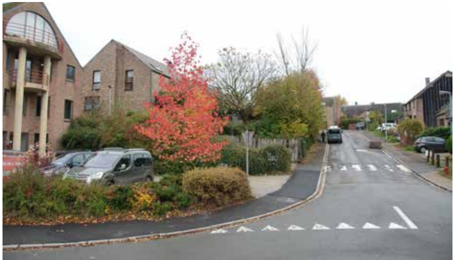
La boucle des Métiers, à Louvain-la-Neuve.

parcelle, on n'a pas besoin de carte de stationnement. Il faut veiller à y placer un panneau «Privé» si l'emplacement n'est pas dans l'allée de sa maison ou devant son garage.»