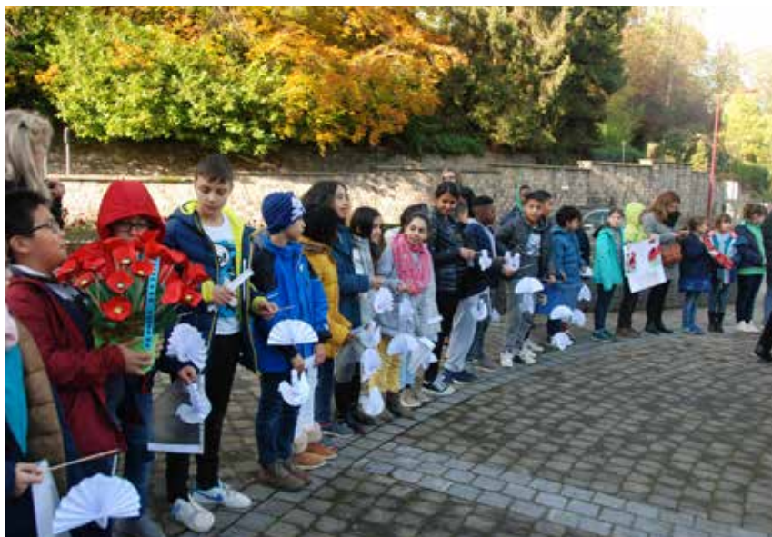
Rassemblés devant le monument de l'Espace Saint-Remy, avec des symboles de la paix.

L'assemblée a rejoint l'hôtel de ville pour entendre les élèves de La Croix commenter des dessins réalisés en classe. Les élèves de Blocry ont récité un poème en tenant des colombes en papier dans les mains. Ils ont aussi présenté des maquettes de tranchées.