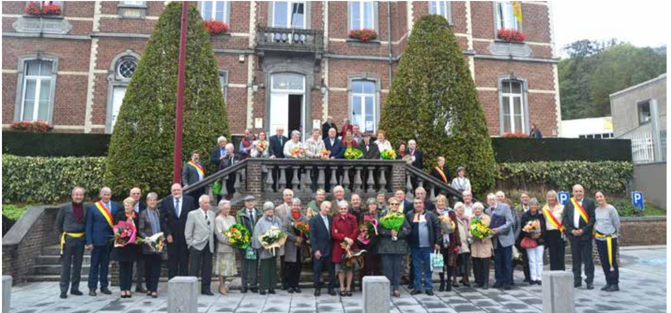
La cérémonie des jubilaires a eu lieu le 19 octobre, pour les couples qui fêtaient leur anniversaire de mariage dans la seconde moitié de cette année.

Voici la liste des couples qui ont fêté leurs 65, 60 et 50 ans de mariage en 2019.