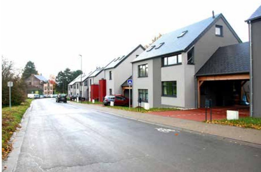
Le chantier de l'avenue des Vallées s'est terminé en 2018.

« La situation des ménages évolue : il y a des décès, des divorces ou séparations, des enfants qui naissent et d'autres qui prennent leur envol... les logements sont alors parfois