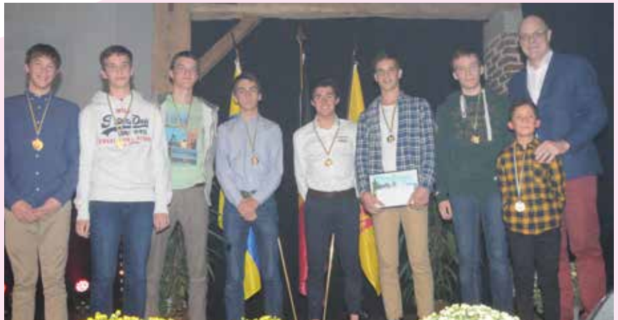
Les espoirs masculins.