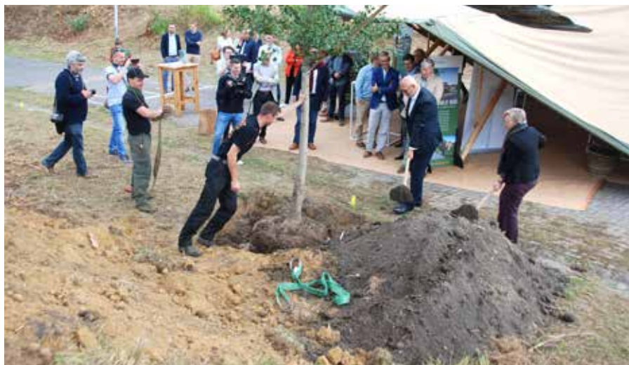
En guise de première pierre, c'est un gingko biloba qui a été planté sur le site du futur quartier de La Balbrière.

Le quartier «La Balbrière» verra le jour en 2021, en contrebas de la séniorerie Malvina (Limelette).