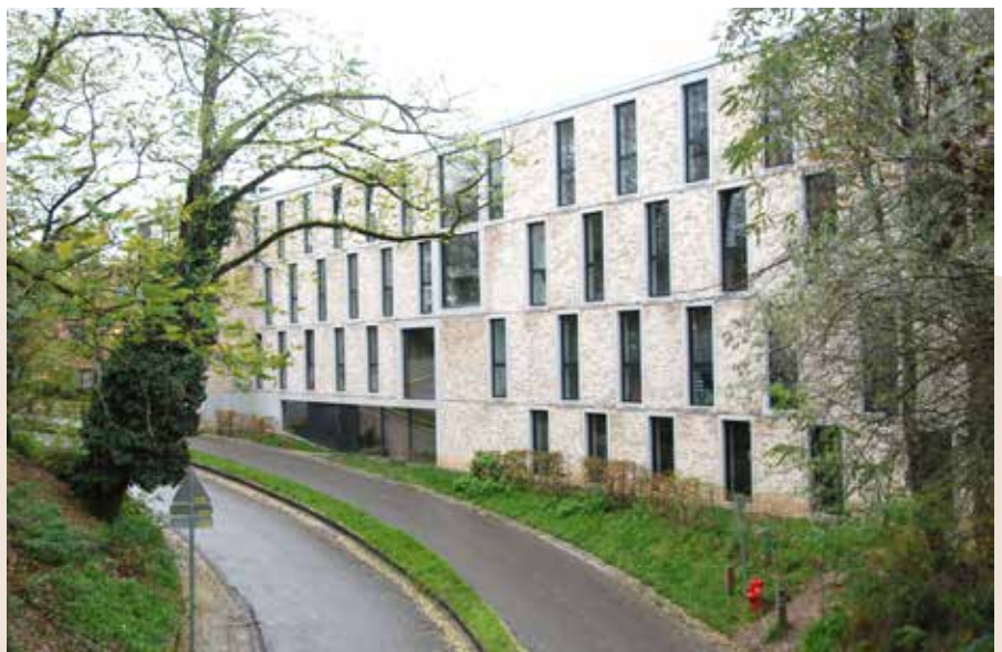
49 kots sociaux inaugurés en 2015, à la place des Paniers.

«Le loyer mensuel (250€ + 60€ de charges) est inférieur aux loyers demandés par les immobilières privées et l'UCLouvain, hors kots-à-projet. Ces kots sont réservés aux étudiants dont les parents disposent de faibles revenus, pour une durée d'un an, renouvelable. L'architecte a