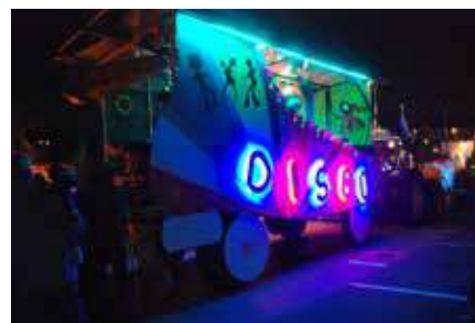
Le char des Thomaziens/ Petit-Ry.