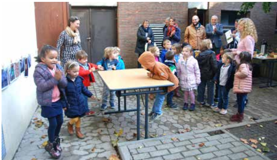
Les élèves de l'école communale maternelle de Cérroux sont incollables sur le système de chauffage du bâtiment qui abrite leurs classes.

Le 10 octobre - à l'occasion de l'inauguration de la nouvelle chaudière biomasse installée dans le garage de la salle communale - ils ont raconté aux journalistes comment les radiateurs de leur école (mais aussi ceux de la salle des fêtes, du restaurant et de la cure) étaient désormais chauffés au départ de déchets de bois broyés et séchés.