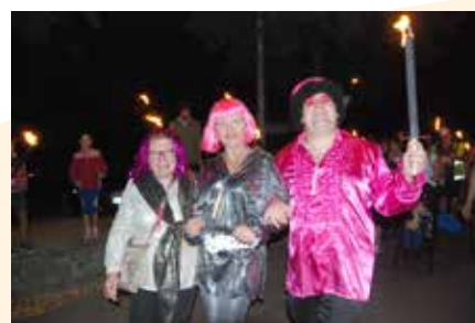
Disco à La Croix.

passer depuis le pas de leur porte, ou sont venus l'étoffer.