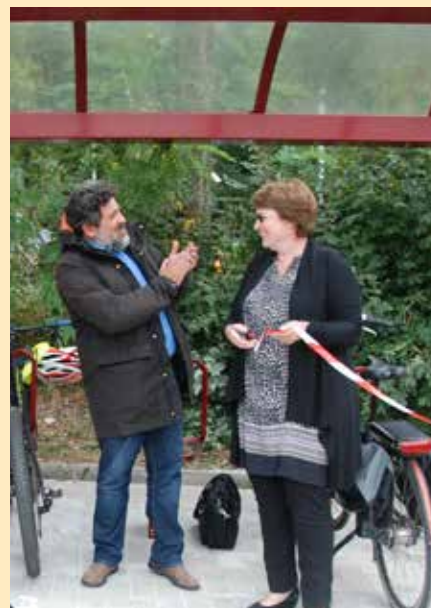
Une collaboration entre plusieurs partenaires, au bénéfice des travailleurs-navetteurs «MoBIB» qui utilisent un vélo personnel ou d'entreprise.

Le service (gratuit) sera testé pendant un an, jusqu'en septembre 2020. Si les utilisateurs se l'approprient comme espéré, et qu'il n'y a pas de vandalisme, d'autres parkings à vélos sécurisés «BIKEEP» pourraient être aménagés, notamment à proximité du Centre sportif de Blocry.