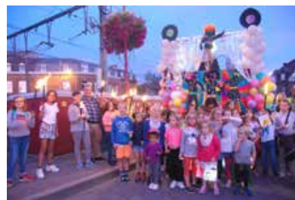
Le char de Limelette.