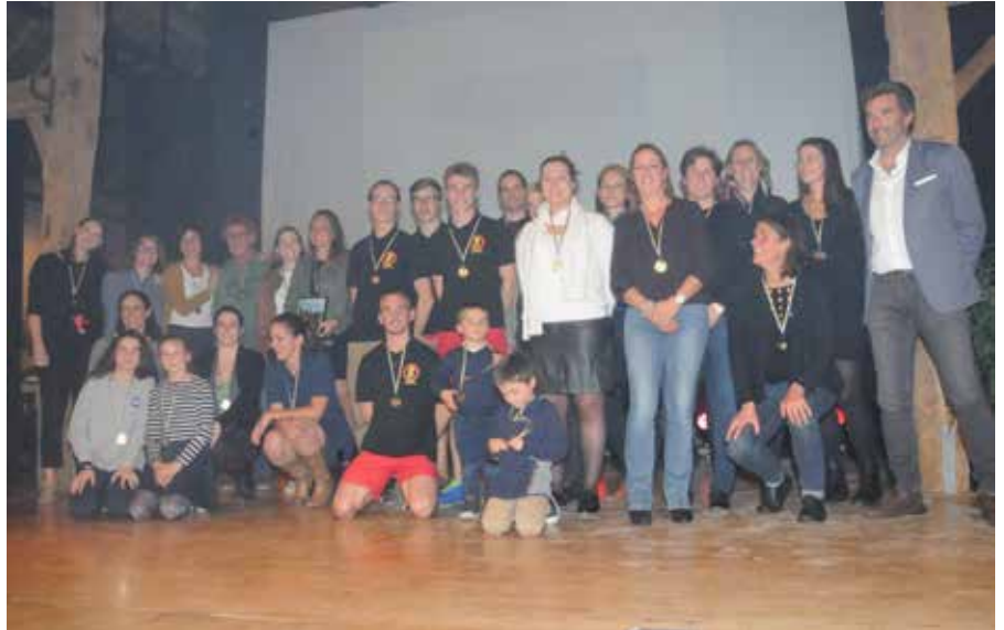
Il y avait plusieurs candidats au mérite collectif, c'est l'équipe Première du Volley Club Limal-Ottignies Smashing Girls qui a été élue.

Espoir collectif: l'équipe U16 du Hockey Club de Louvain-la-Neuve. Montée en Nationale 1.