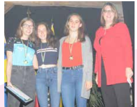
Les espoirs féminins.

Mérite collectif: l'équipe Première du Volley Club Limal-Ottignies Smashing Girls. Premier club féminin du Brabant wallon à atteindre le niveau de ligue B.