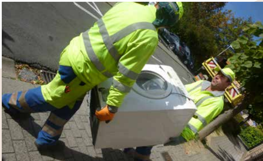
Nos ouvriers transportent les objets avec précaution.

« La récolte des objets peut durer 10 minutes – si les locataires ont tout vidé eux-mêmes – ou la journée entière, on le découvre sur place. Le service Travaux met le nombre d'hommes à disposition, en fonction des besoins. Nous avons eu le cas d'une entreprise dont il fallait évacuer tout le stock! Finalement, l'huissier a fait appel à ses déménageurs pour s'en occuper. Il nous aurait fallu plusieurs jours... » ■