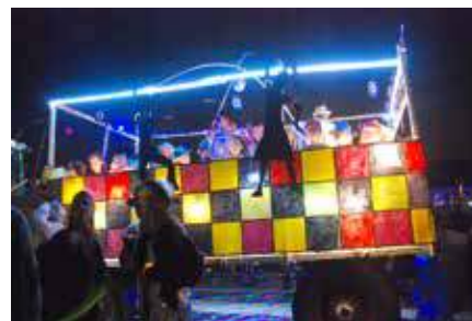
Le char du Bon Air.

Nous avons suivi le char de La Croix jusqu'à son arrivée au centre d'Ottignies et constaté combien nos habitants sont attachés à cette tradition: déjà la 36 e marche aux flambeaux. Nombreux ceux qui ont applaudi le cortège en le regardant