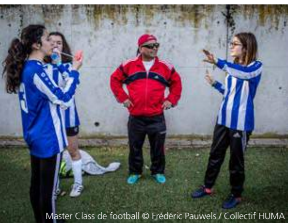
Master Class de football

L'Asbl Panathlon promeut les valeurs qui font du sport une activité où chacun s'épanouit : fair-play, respect, solidarité, fraternité ou encore amitié. Un objectif ambitieux qui ne peut se réaliser qu'avec les acteurs du monde sportif et du monde citoyen. Ainsi, la Commune de Watermael-Boitsfort a réalisé de nombreuses actions pour sensibiliser au fair-play : un arbre a été planté au Parc Sportif des 3 Tilleuls pour rappeler qu'il s'agit d'un espace privilégié de diffusion des valeurs sportives.