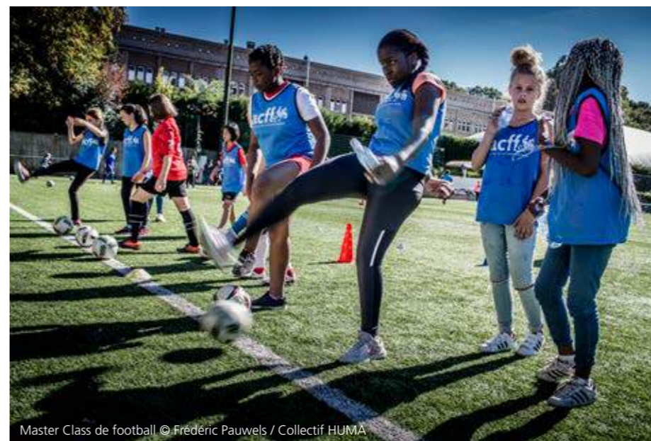
Master Class de football

"De masterclass voorzag enerzijds een opleiding op maat om jonge talentvolle spelers naar de Belgische voet-