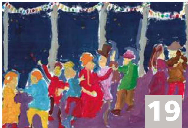
Bal populaire Volksbal