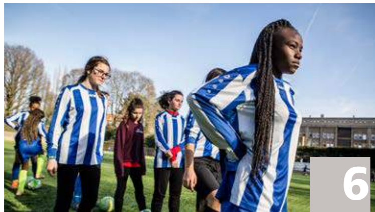
Dossier : Sport et valeurs Dossier Sport en waarden