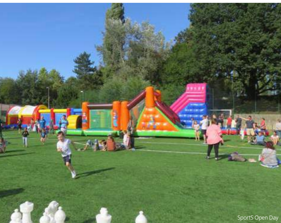
SportS Open Day

Op zondag 8 september zal van 10 tot 16 uur de 5de editie van de SportS Open Day in de Sportwarande der 3 Linden worden gehouden. Neofieten, amateurs of overtuigde sporters kunnen zich de hele dag komen