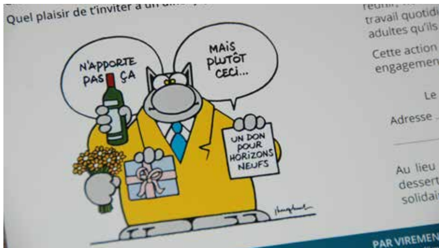
Sur l'invitation que vos invités recevront, il est indiqué que vous ne souhaitez ni fleurs, ni bouteille de vin... mais que vos dons sont les bienvenus pour le projet d'Horizons Neufs.

L'ASBL Horizons Neufs a imaginé un projet «Dîners solidaires» avec Philippe Geluck et Yves Mattagne. Invitez vos amis à participer au financement de la résidence «Les Artisans», qui permettra d'héberger 18 personnes handicapées mentales âgées, à Louvain-la-Neuve. Ce sera leur façon de vous remercier du bon repas que vous leur préparerez.