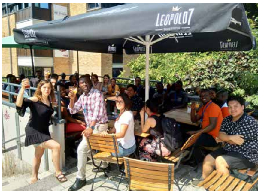
La vie à Louvain-la-Neuve est riche aussi de ses « après cours ». Les candidats au programme Access2University rencontrent des représentants du monde associatif, au café Altérez-Vous.