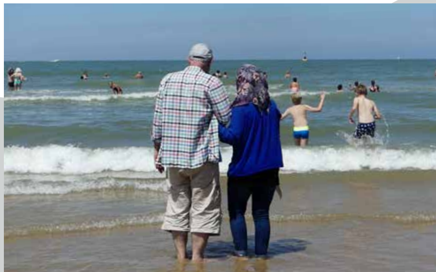
Une journée à Ostende, le 5 juillet.

«Il y a presque autant de bénévoles du Gracq que d'apprentis cyclistes: un beau mélange de cultures et de générations. La police participe à une journée, cela permet de briser les stéréotypes. Le dernier jour, on fait une balade et on mange ensemble.»