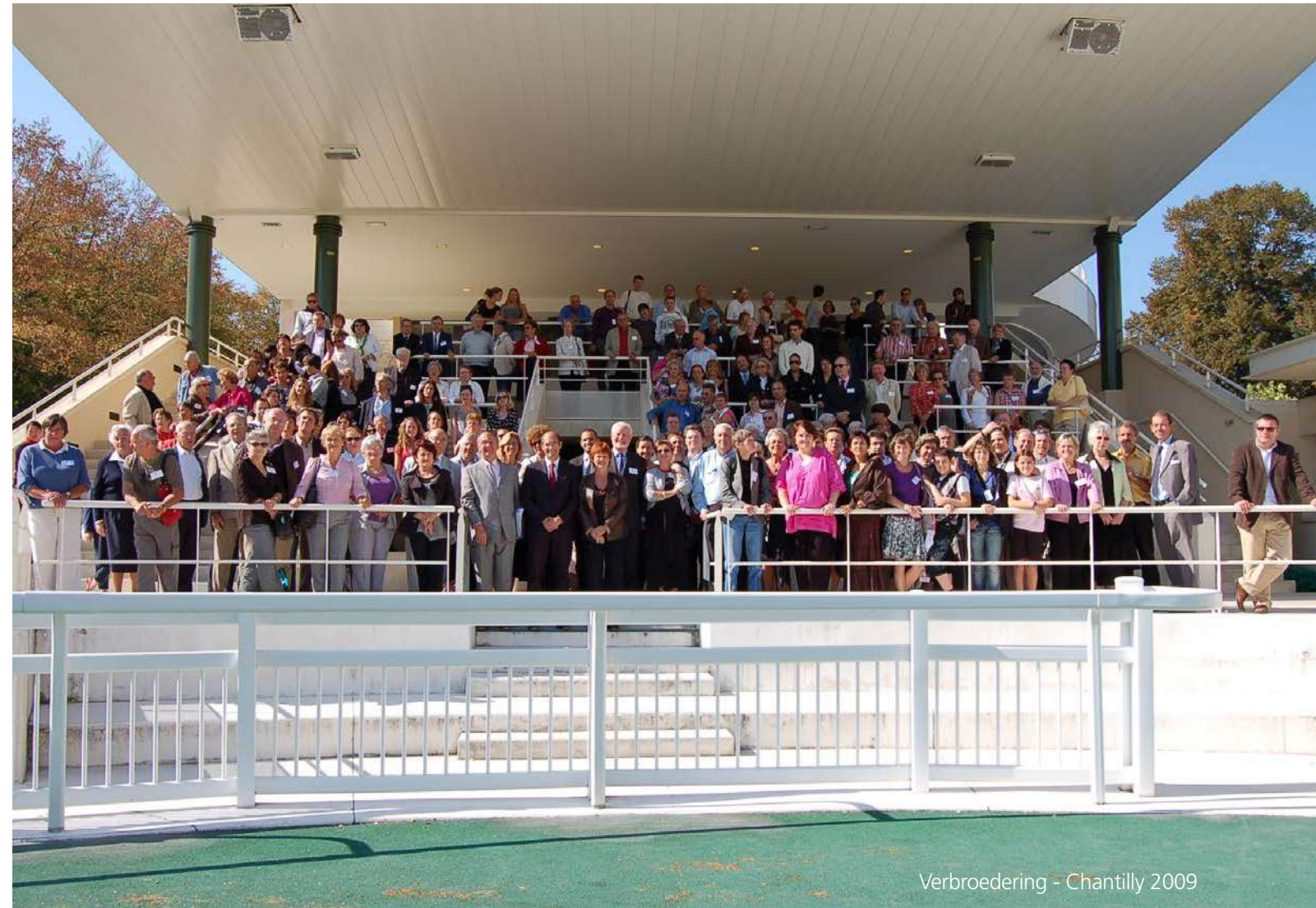
Verbroedering - Chantilly 2009