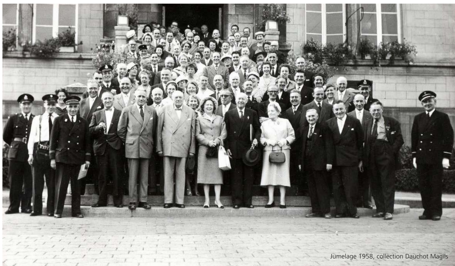
Jumelage 1958, collection Dauchot Magils