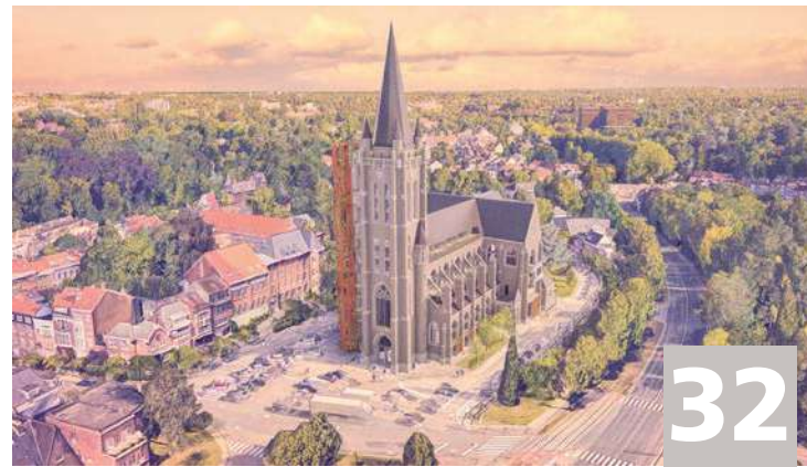
Logement Église Saint-Hubert Huisvesting Sint-Hubertuskerk