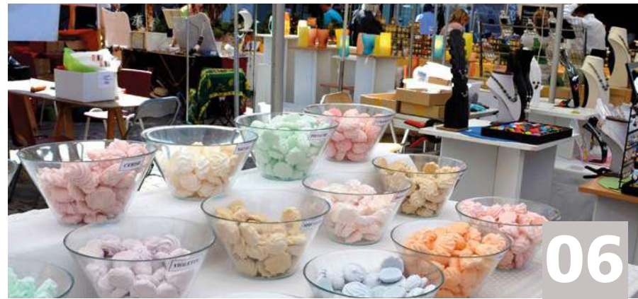
Vie économique / Economische Leven